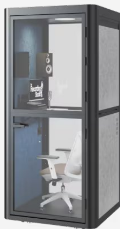
Canto & Grabación