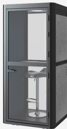
Trabajo de Oficina