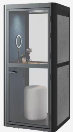
Reunión en Línea